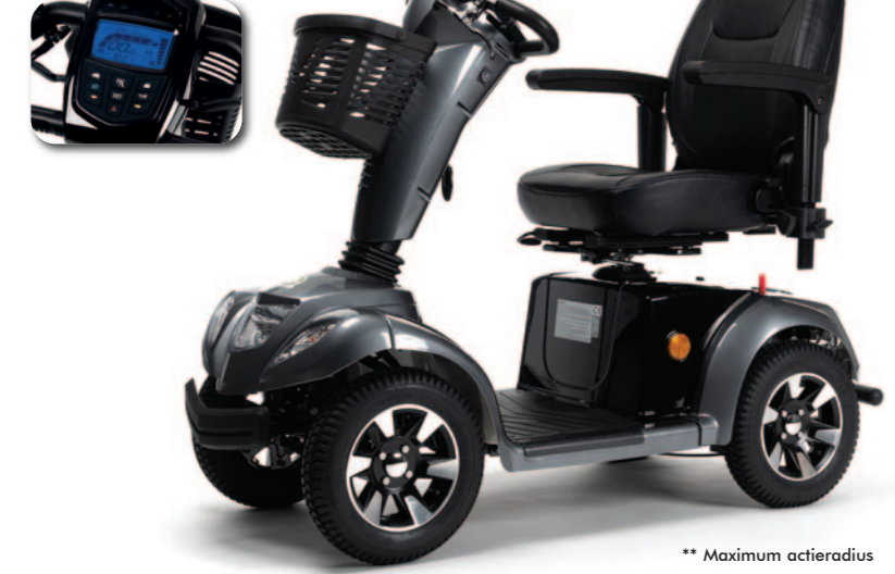
** Maximum actieradius