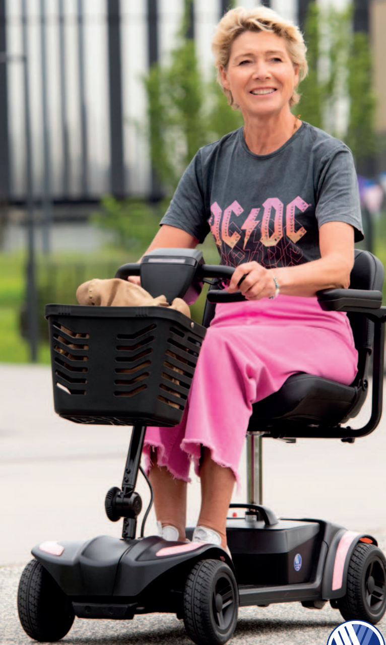
Afgebeeld model enkel ter illustratie. Sommige zaken kunnen optioneel zijn.