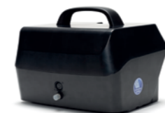
25 AH batterij voor een grotere actieradius.