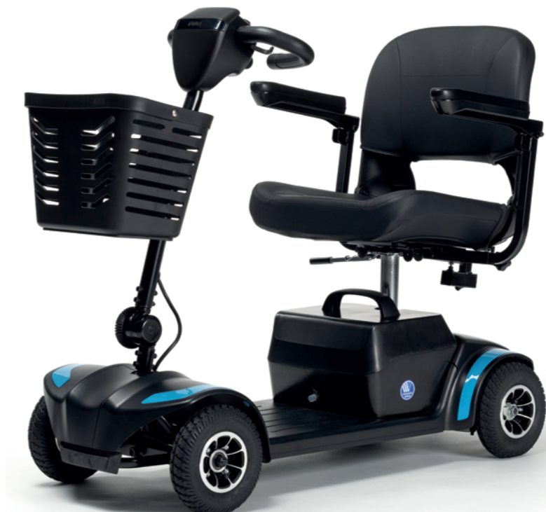
** Maximum actieradius