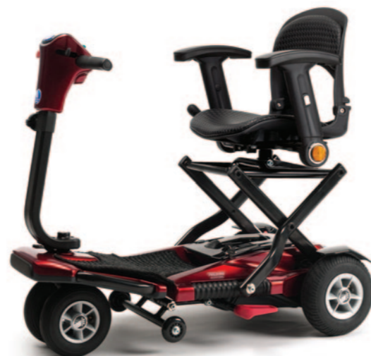
** Maximum actieradius