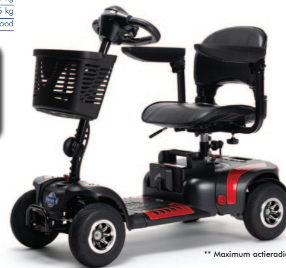
** Maximum actieradius