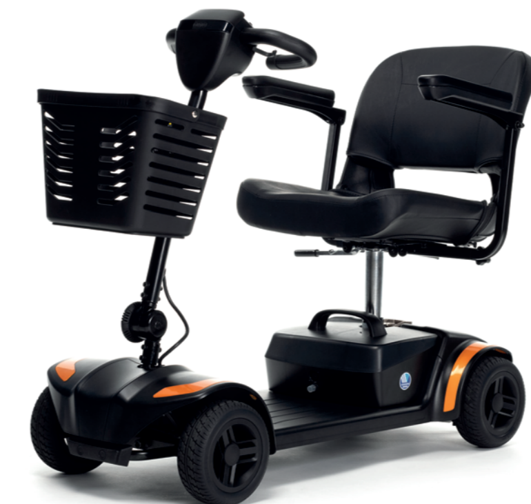
** Maximum actieradius

Dankzij de kleine draaicirkel is de One scootmobiel een perfecte compact indoor scootmobiel voor dagelijkse uitstapjes naar de supermarkt, het navigeren in kleine ruimtes of je eigen woning. Doordat hij volledig demonteerbaar is, kan je hem makkelijk opbergen of meenemen op reis. Andere troeven zijn een roterende stoel, een LED batterij display en een aanpasbare armsteun.