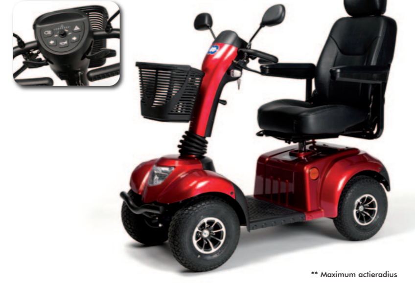
** Maximum actieradius