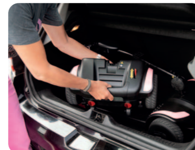
Eenvoudig mee te nemen in bijna elk type van wagen.