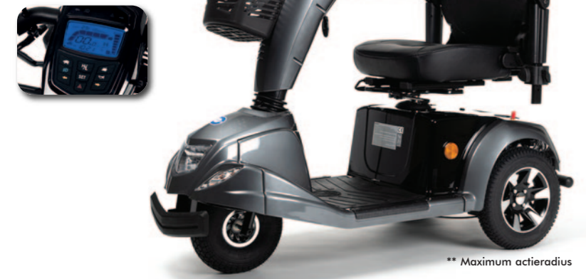
** Maximum actieradius