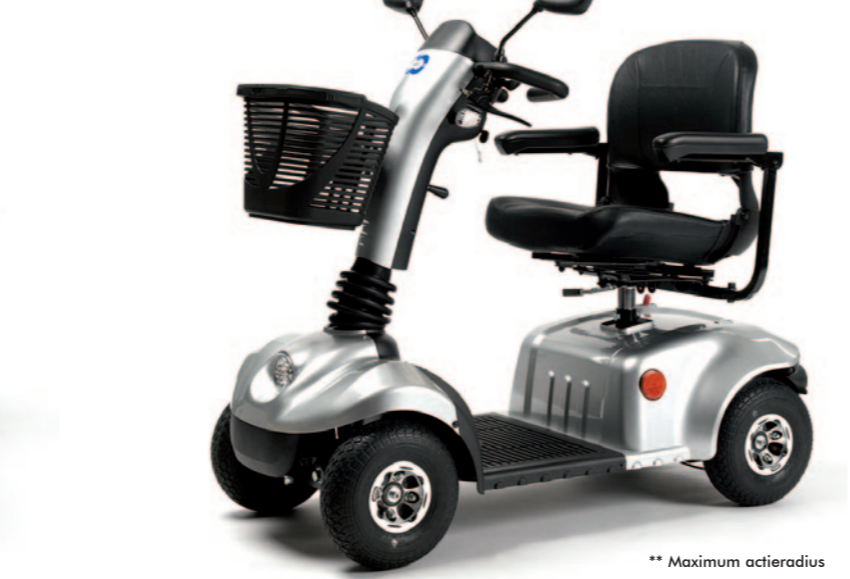
** Maximum actieradius