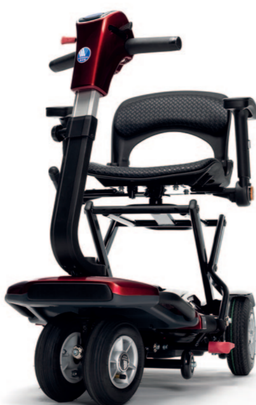
** Maximum actieradius

SEDNA is de perfecte meeneembare scootmobiel die je kan opvouwen in 1 enkele beweging. Voet op het pedaal, duwen, vergrendelen en meenemen. Tevens voorzien van een draaibare zit met wegklapbare en aanpasbare armsteunen met zijdelingse reflectoren en een uitneembare lithium batterij met anti-diefstal slot en luchtbanden.