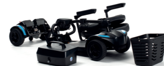
Volledig demonteerbaar zonder extra gereedschappen