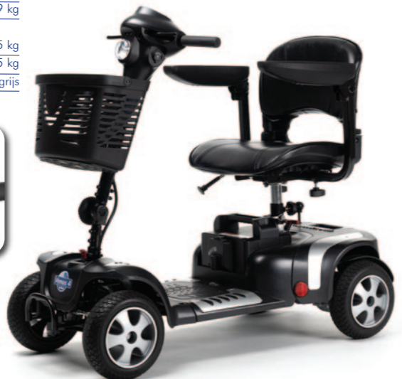
** Maximum actieradius